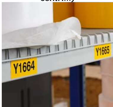
Obeležavanja imovine (inventarske pločice)